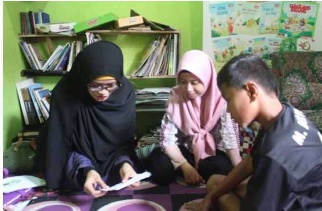
Gambar 1. Pengecekan kemampuan awal para peserta kegiatan

Kegiatan kedua dalam kegiatan ini adalah fasilitator membuka dengan kegiatan motivational upgrading . Motivational upgrading dilakukan terlebih dahulu untuk meningkatkan motivasi dari pengunjung yang masih tergolong anak-anak dalam mengikuti program ini. Pada tahap ini, fasilitator memperkenalkan buku-buku bercerita bergambar yang menggunakan 2 bahasa, yaitu bahasa Inggris dan bahasa Indonesia.