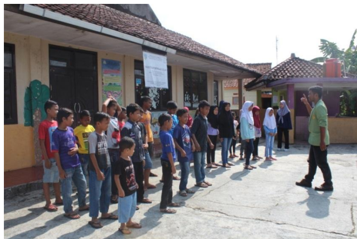
Gambar 2. Motivational Upgrading

Kegiatan kedua dalam kegiatan ini adalah fasilitator membuka dengan kegiatan motivational upgrading . Motivational upgrading dilakukan terlebih dahulu untuk meningkatkan motivasi dari pengunjung yang masih tergolong anak-anak dalam mengikuti program ini. Pada tahap ini, fasilitator memperkenalkan buku-buku bercerita bergambar yang menggunakan 2 bahasa, yaitu bahasa Inggris dan bahasa Indonesia.