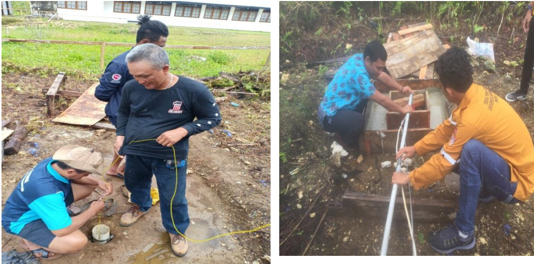
Gambar 2. Lokasi Pengambilan Sampel