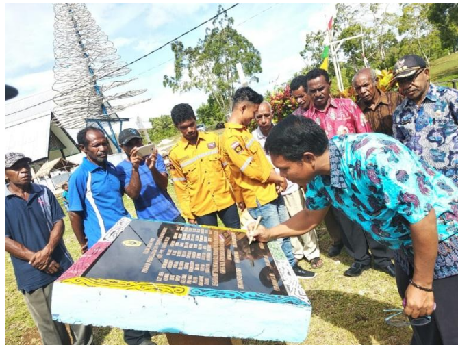
Gambar 4. Penandatanganan Prasasti Hasil Penyediaan Air Bersih

Tangki air yang digunakan terbuat dari bahan fiberglass berbentuk tabung yang memiliki kapasitas sebesar 5000 liter. Untuk tempat pengambilan air untuk kebutuhan masyarakat, dilakukan penyambungan pipa dari tangki air menuju ke bawah dengan jumlah pipa pengaliran adalah sekitar empat pipa yang sudah disambung atau dipasang kran air.