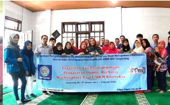
Gambar 3.2 Tutor dan Peserta Pelatihan

Membuat akun marketplace tidak membutuhkan waktu lama, cukup satu hari. Namun untuk mengembangkan akun tersebut butuh proses terus-menerus sepanjang bisnis dijalankan. Operator perlu melakukan update setiap kali produk baru dipasarkan, mengupdate harga-harga serta perubahan informasi produk, menjawab pertanyaan konsumen, memproses pesanan barang, memproses pembayaran produk, mengirimkan informasi pengiriman produk, hingga menanggapi keluhan konsumen. Oleh karena itu, pendampingan dilakukan oleh Tim Tutor selama satu bulan guna memonitor proses pelaksanaan pemasaran online yang sebenarnya pada kedua akun marketplace tersebut. Setelah satu bulan didampingi dari kejauhan, diharapkan perusahaan CV LZA dapat mandiri dan mengembangkan model pemasaran onlinenya.