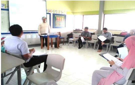
Gambar 3.1 Pelatihan Pemasaran Online Berbasis marketplace