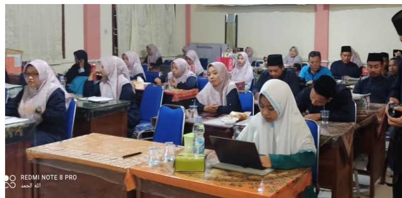
Gambar 5. Sesi Tanya jawab

Selanjutnya, sesi yang paling ditunggu oleh para peserta yakni tanya jawab. Dalam sesi ini, para guru akan menyampaikan berbagai pengalaman beliau dalam menghadapi perilaku peserta didik serta mengajukan pertanyaan terkait penanganan yang tepat (Gambar 5).