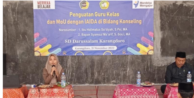
Gambar 4. Penyampaian Materi PFA (Sumber: Dokumentasi, 2022)

pemahaman baru untuk para guru (Gambar 4). Program ini diterima baik oleh para pemangku kebijakan dan pelaksana atau para guru BK dan guru wali kelas yang akan berhadapan langsung dengan para peserta didik.