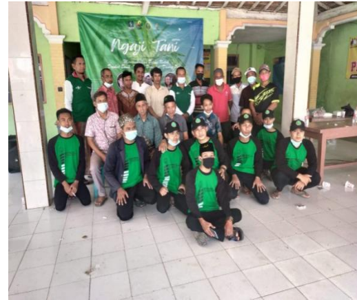
Gambar 4. Ngaji Tani Bersama Para Ahli Bidang Pertanian