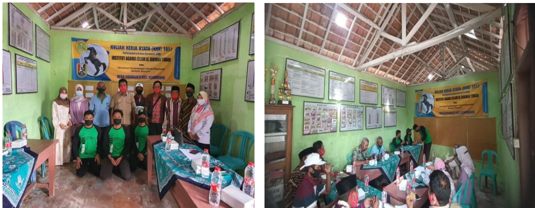
Gambar 3. FGD ( Focus grup discussion )

Maka dari itu penulis membatu mewujudkan harapan harapan masyarakat khususnya petani untuk mengadakan pelatihan penyuburan tanah dengan sistem organik serta memandirikan petani untuk daulat benih, daulat produksi, daulat pasar. dengan mendatangkan pemateri yang ahli dalam bidang Pertanian. Yakni dari Asosiasi Petani Indonesia (API JATIM) Lembaga Pertanian Nahdltul Ulama' (LPP-NU SOKO) dan dari Serikat Petani Tuban.