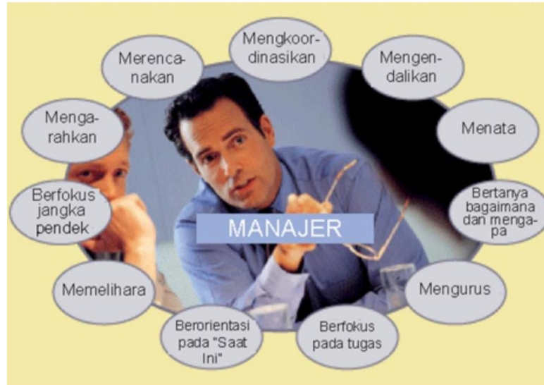
Gambar 2. Tugas Manajer

struktur organisasi yang sesuai yang diperlukan organisasi untuk mencapai tujuannya, dan kelangsungan hidup organisasi di lingkungannya.