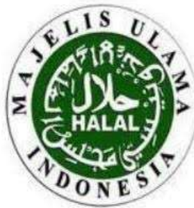
Gambar 1. Logo Label Halal MUI

Menurut Zulham (2016:116) labelisasi membantu konsumen untuk mengetahui sifat dan bahan produk, sehingga memungkinkan bagi konsumen untuk memilih berbagai produk yang saling bersaing. Informasi inilah yang dibutuhkan konsumen pada produk halal, dengan informasi yang simetris, konsumen dapat menentukan pilihannya untuk mengonsumsi produk halal, karena informasi yang simetris merupakan kesejahteraan bagi konsumen, sehingga dengan labelisasi tercipta keadilan pasar bagi konsumen. Adapun bentuk logo halal yang didukung oleh sertifikat halal dan mana yang tidak. Logo halal yang didukung oleh sertifikat MUI yaitu :