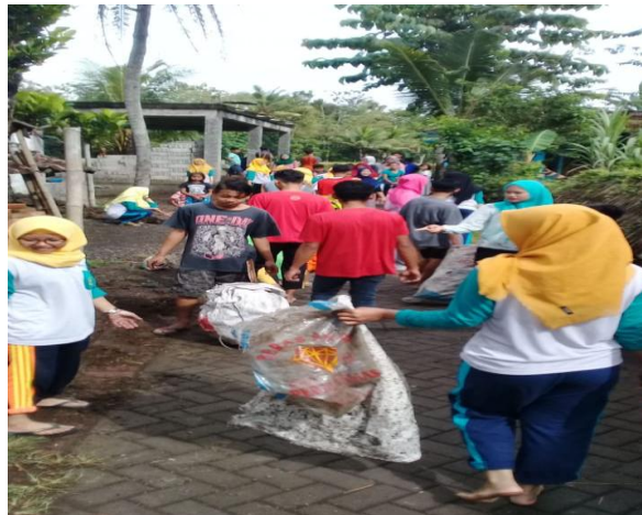
Gambar 3.4 Minggu Bersih di Dusun Andongsari

Kegiatan ini dimulai pada pukul 07.00 WIB, bertempat di halaman balai dusun senam ini didahului dengan senam bersama selama 15 menit dan dilanjutkan bersih dusun yang dilakukan oleh masyarakat Dusun Andongsari , mulai dari anak-anak, remaja, dewasa hingga orang tua.