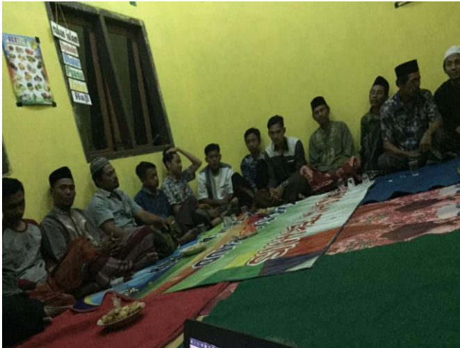
Gambar 3.2 Berdiskusi Dengan Tokoh Masyarakat Dusun Andongsari