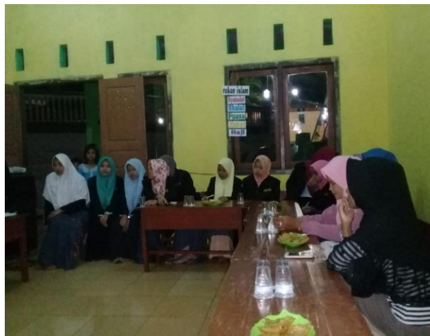
Gambar 3.1 Pemberdayaan Remaja Dusun Andongsari

Adapun pengabdian dampingan kami bekerja sama dengan remaja adalah mengadakan kegiatan minggu bersih. Dengan remaja sebagai koordinator dari dusun dan mengajak masyarakat untuk ikut pengabdian tersebut. Juga pengabdian membentuk organisasi remaja.