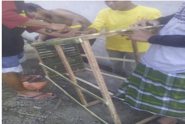
Gambar 3.5 Membuat Tempat Sampah Bambu

khusus RT yang dekat dengan persawahan mendapat 2 buah tempat sampah bambu. Dengan adanya tempat sampah bambu itu masyarakat membuang sampah rumah tangganya ke tempat sampah itu dan tidak membuangnya di sawah atau selokan.