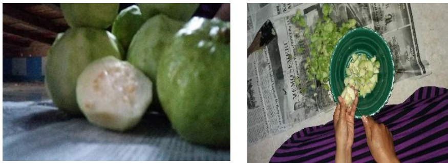
Gambar 3.1 Proses Pemilihan Jambu Kristal

Adapun proses pembuatan Dodol Jambu Kristal sebagai berikut: