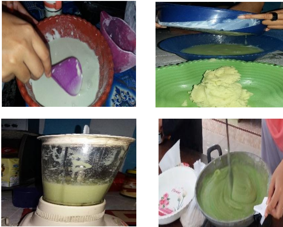
Gambar 3.2 Proses Pembuatan Dodol Jambu Kristal