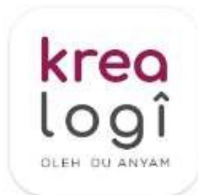
Gambar 3. Aplikasi Krealogi Di Google Play Store Atau App Store

Gambar 2. menunjukkan kegiatan pelatihan dimulai dengan pre-test kepada UMKM AL Farizi Tapis mengenai pengetahuan dan kemampuannya tentang pembukuan dan pencatatan stok serta aplikasi Krealogi. Setelah dilakukan pre-test selanjutnya dilakukan pengenalan Aplikasi Krealogi dari mulai kegunaan, tampilan, fitur- fitur dan cara membuat serta mengaplikasikannya di UMKM AL Farizi Tapis. Aplikasi Krealogi dapat di download di google play store ataupun app store dengan tampilan berikut: