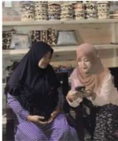
Gambar 2. Pelatihan dan Pendampingan Penggunaan Aplikasi Krealogi di UMKM AL Farizi Tapis (Sumber: Dokumentasi Lapangan, 2023)

Gambar 1. menunjukkan kegiatan pembuatan aplikasi krealogi dan pembukuan untuk bulan Agustus 2023. Dalam kegiatan membantu pemindahan pencatatan keuangan ini dilakukan satu kali dalam satu minggu.