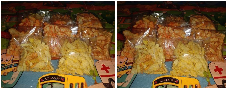
Gambar 3. Pengemasan

Tahap Kelima. Proses pengemasan produk. Setelah semuanya sudah digoreng selanjutnya adalah proses pengemasan produk. Sebelum dikemas kerupuk beras yang sudah digoreng akan dicampur dengan bumbu-bumbu serbuk agar memiliki berbagai varian rasa seperti barbeque, jagung manis, pedas gurih dan balado pedas manis. Pengemasannya menggunakan plastik untuk camilan karena pada dasarnya kerupuk beras ini bukan hanya digunakan untuk lauk melainkan juga digunakan untuk camilan.