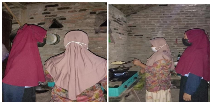
Gambar 2. Proses Penggorengan Kerupuk

Tahap Keempat. Proses penggorengan. Setelah kerupuk kering maka langkah selanjutnya adalah proses penggorengan. Pada tahap ini proses penggorengan menggunakan minyak yang sudah panas dan digoreng secara berkelanjutan. Tetapi jangan lupa jika minyak sudah panas maka apinya sedang saja.