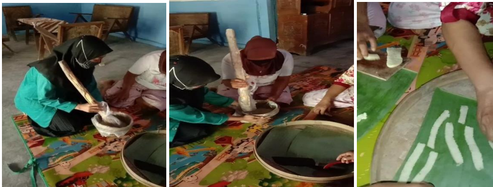
Gambar 1. Proses Pembuatan Kerupuk

Gambar 1. di atas merupakan gambar proses pembuatan kerupuk. Setelah semuanya selesai dilakukan selanjutnya adalah proses pengeringan. Pengeringan dilakukan dibawah sinar matahari, prosesnya bisa mencapai 2-4 hari tergantung panas mataharinya.