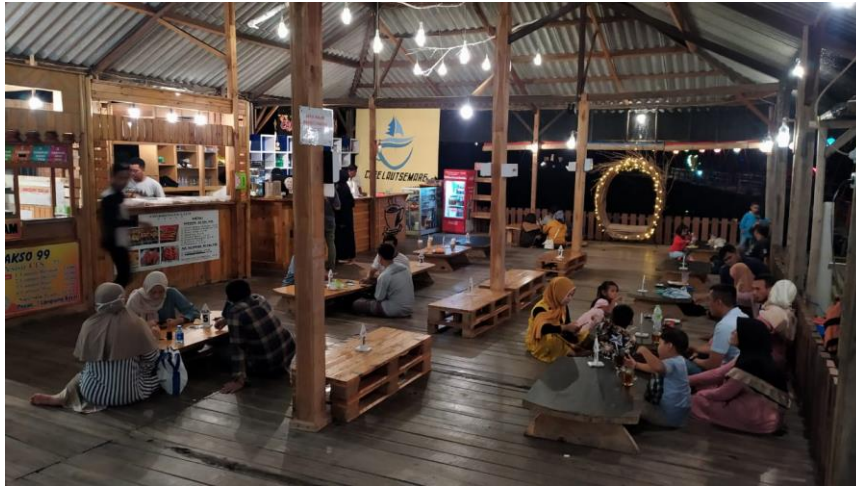
Gambar 2. Cafe Laut Semare

Dengan berdirinya cafe laut semare membuktikan Desa Semare dapat menjadi Desa Wisata. Setiap akhir pekan cafe laut semare begitu ramai dengan wisatawan dari berbagai daerah di Pasuruan hingga luar negeri. Namun kondisi ini selama belum diberlakukannya pembatasan kegiatan masyarakat (PPKM) Pada saat pandemi ini tentu sangat berdampak kedalam sektor kepariwisataan. Mengikuti anjuran pemerintah terkait penertipan protokol kesehatan, cafe laut semare juga telah mempersiapkan protokol kesehatan dalam bentuk menyediakan sarana tempat cuci tangan serta pemberlakuan jaga jarak ( physical distancing ) pada area cafe.