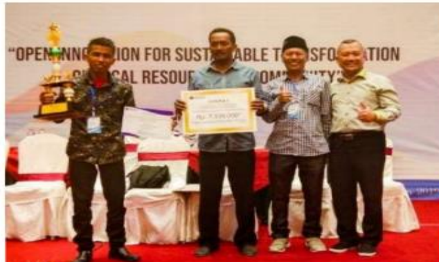
Gambar 3. Juara 1 UB Community Service Awards 2019

Desa Semare berhasil meraih juara 1 untuk kategori inovasi Rekayasa Sosial tentu hal ini tidaklah mudah mengingat bersaing beberapa desa lain di Jawa Timur termasuk Desa Diponggo, Pulau Bawean, Kabupaten Gresik, serta Desa Sidoasri, Kecamatan Sumbermanjing Wetan, Kabupaten Malang.