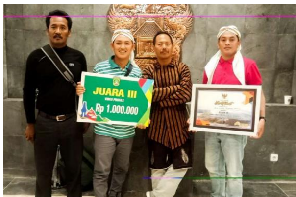
Gambar 4. Juara 3 Video Profil Desa se-Kabupaten Pasuruan pada 2019