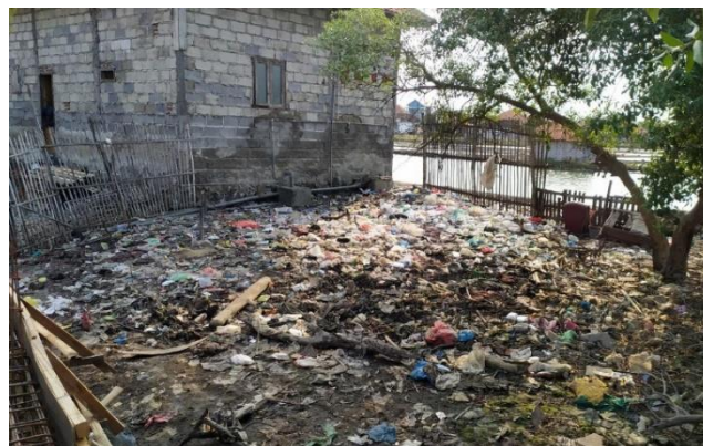
Gambar 6. Sampah di Pesisir Pantai dan Lingkungan Masyarakat

Selain forum diskusi, kegiatan bersih desa merupakan bentuk kontribusi nyata kelompok sadar wisata dalam upaya menjaga kebersihan lingkungan dan mewujudkan tujuannya menjadikan semare sebagai desa wisata. Kelompok sadar wisata cafe laut semare juga memberikan fasilitas berupa tempat sampah untuk setiap rumah di Dusun Pagaran untuk menunjang pembentukan citra desa wisata yang bersih.