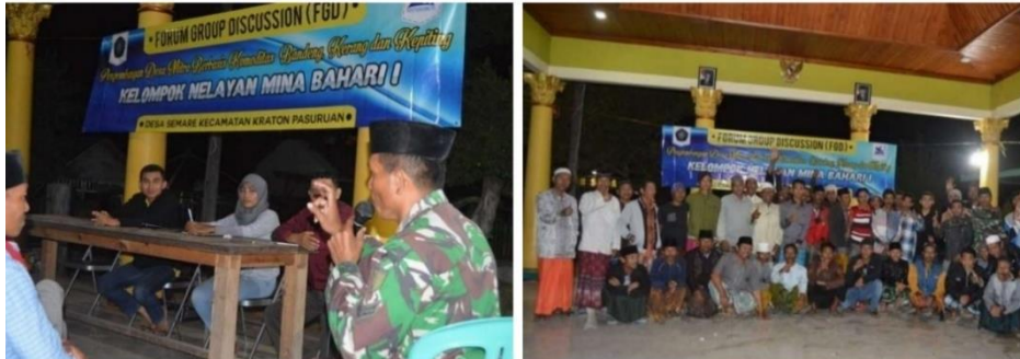
Gambar 5. FGD bersama POKDARWIS

Selain forum diskusi, kegiatan bersih desa merupakan bentuk kontribusi nyata kelompok sadar wisata dalam upaya menjaga kebersihan lingkungan dan mewujudkan tujuannya menjadikan semare sebagai desa wisata. Kelompok sadar wisata cafe laut semare juga memberikan fasilitas berupa tempat sampah untuk setiap rumah di Dusun Pagaran untuk menunjang pembentukan citra desa wisata yang bersih.